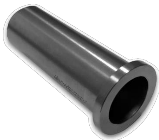
BLASER Bodenhülse 20