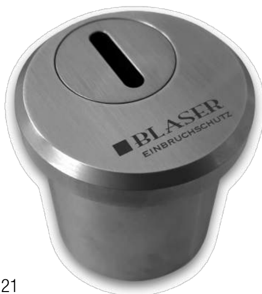
BLASER Zylinderschutz Trok 21